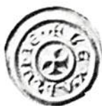
LL IV:8 a 1229