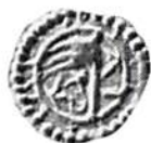
LL VIII:1 1247–51