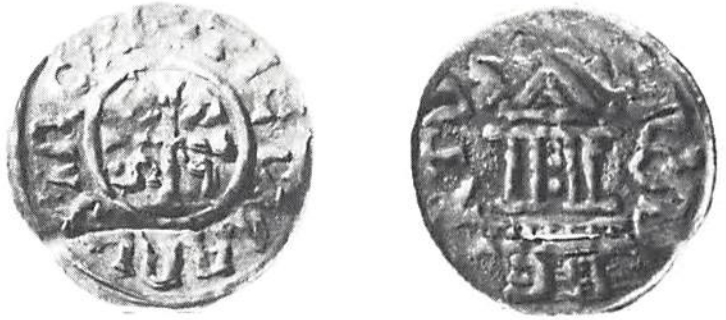
1. Ärkebiskop Dietmar II (1025—41), Salzburg. Dbg 1149

Tre av de mynt från "Störtfjällsskatten" som ställts ut i Mölnalds museum Förstoring 2:1.