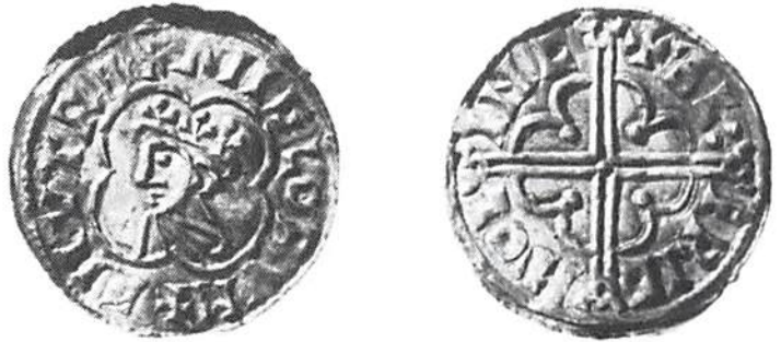
2. Cnut den Store (1016—35), Quatrefoil Type (c. 1017—23) Lincoln, Ælfric. Hd 1481