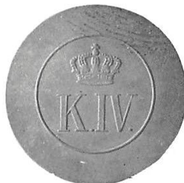
Exempel på militärpolletter.