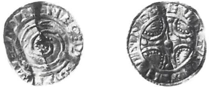
3. Danmark, Knut (/Hardaknut?) Lund, Jfr Hbg II:20

Sekundära men betydande faktorer för samhällets vidare växt har varit närheten till skog och jordbruk, till hav, hamnar och — sist men inte minst — till det kapitalstarka Göteborg.