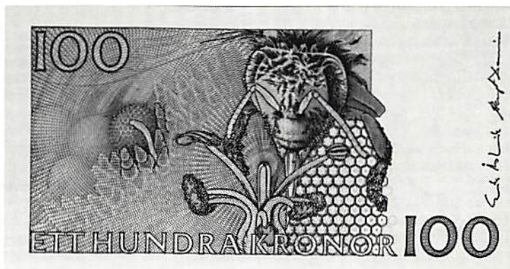
Fig. 4. Sedels baksida.