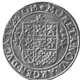
Fig 8 a-c. Pommern, Kristina, 1/2 taler 1640 (a), 1641 (b) och 1646 (c).