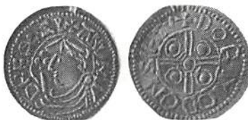
Kopia efter Anund Jakob (LL17).

Ovanstående "mynt" har inköpts hos en mynthandlare i Göteborg. På den illa medfarna påsen står skrivet med skrivstil följande: "Anund Jakob. Då jag aldrig har utsikt att få ett orgin gjorda jag ett själv. Stampen sprang vid 40 tons tryck. 6X existerar 30.-" Det är