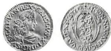
Fig 6. Reval, Karl XI, dukat 1677.

Pommern behärskades sedan 1630 av Sverige och blev besittning 1638, accepterat i Westfaliska freden 1648. Den svenske monarken lade värdigheten "hertig av Pommern" till sina övriga titlar. Från Kristina (regent i Pommern 1638–54) finns tre dukater, alla av olika typer, och sju talrar från olika år, samtliga (!) tre typer av 1/2-talern, varav den första (1640) är den ena av två ex. i enskild ägo. Kungl. Myntkabinetet köpte ju på sin tid (1897) Oldenburgs ex. för 465 kr. Vidare finns både 1653 och 1654 av de ytterst sällsynta 1/8-talrarna. Många fler skulle vara värda att nämna, men vi går vidare.