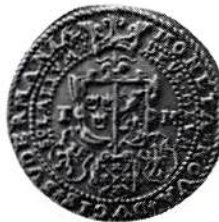
Fig 2. Hertig Karl, Nyköping, 1 mark 1587.

präglingen i Svartsjö och från den perioden kommer den rara klippingen 1543 med den märkliga valören 15 öre, dvs 1 7/8 mark, ett slags krigsmynt om man så vill.