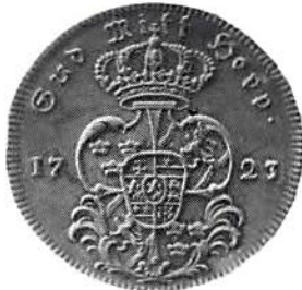
Fig 4. Fredrik I, 1 riksdaler 1723, Krellska serien.

Gustav II Adolf bjuder på den ytterst sällsynta talern 1632, som anses vara slagen i Fürth. 4-kreuzern 1632, tillskriven samma stad och av typen med kungens bild, inte sedd på auktion i mannaminne, finns i två exemplar! Würzburgs dukat 1632, 1 taler samt halvan i två ex. och fjärdedelen bör nämnas. Innan vi går över till Pommern kan vi framhålla några ovanliga Reval-mynt från Karl XI: dukaten 1677, 4 mark 1664, 2 mark samma år samt 1671 och ett stort antal smärre valörer.