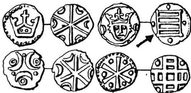
Verkligt usla är de danska borgarkrigsmynten från 1200-talet, om de nu ska kallas mynt. Inskrifter saknas. På ett ser man bilden av ett halster, symbol för Sankt Laurentius, Lunds domkyrkas skyddshelgon.

Riksbankens försök med sk sedeldepåer har utvärderats. Två postkontor – i Norrköping och Karlskrona – har för Riksbankens räkning förvarat sedlar för att underlätta för banker och post i regionen. Riksbankens slutsats är att sedeldepåer inrättas enbart på orter där riksbanken redan har ett kontor (9 region- och 13 kassakontor), samt om ett kassakontor skall dras in skall Riksbanken från fall till fall pröva om det skall ersättas av en sedeldepå (Redog. 1986/87:15 och Förs. 1986/87:13).