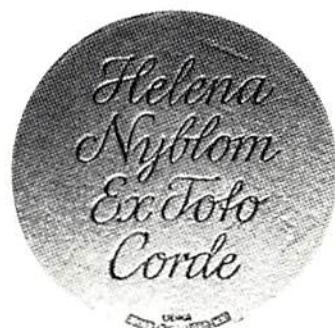
Medaljen efter exemplar i Kungl Myntkabinetet.