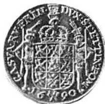
Fig 9. Pommern, Karl XI, 2 dukater 1690.

Med Karl XII kommer 1 dukat 1709, talern i medaljstil samma år samt 4 st guldenmynt. Det efter freden starkt förminskade Svenska Pommern hade som bekant en rik och mestadels underhållig utmyntning under vårt föga framgångsrika deltagande i sjuårskriget mot Preussen och Fredrik den store. Adolf Fredrik är också rikligt representerad; i toppen finner vi de två enda guldmyntvalörerna, 10 och 5 taler 1759, även kallade dubbel och enkel adolpsh'd'or, mycket ovanliga. Särskilt vackert är ett av de fyra ex. av gulden 1763. 8 gute groschen med kronnåsan hittar vi givetvis!