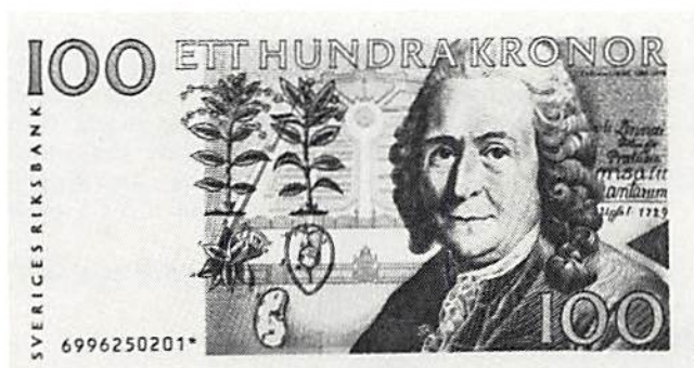
Fig. 1. Hundrakronorsedelns framsida. Med stjärnmärke. Dimension: 72x140 mm.