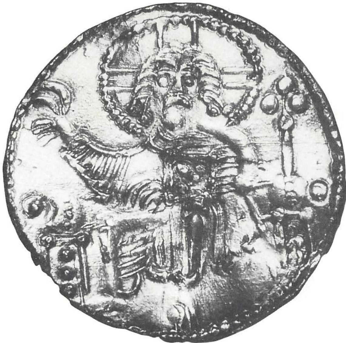
Dansk silverpenning, slagen för Sven Estridsen (1045–75). Åtsidan, som vi ser här i stark förstoring, är en imitation av ett bysantinskt mynts tronande Kristusgestalt. Penningen har hittats i Blekinge och förvaras i Lunds universitets myntkabinett.