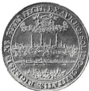
Fig 7. Riga, Karl X Gustav, 6 dukater 1655 med omgraverat årtal.