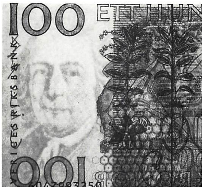
Fig. 3. Vattenmärket och säkerhetstråden. Genomlyst.

Den som vill veta mera om de mycket äldre sedlar, som blir ogiltiga 1/1 1988 och om de som fortfarande är giltiga, bör rekvirera broschyren "Sveriges Sedlar" från antingen Riksbanken, tel. 08-787 00 00 eller från Tumba Bruk, tel 0753-695 00. Lennart Wallén