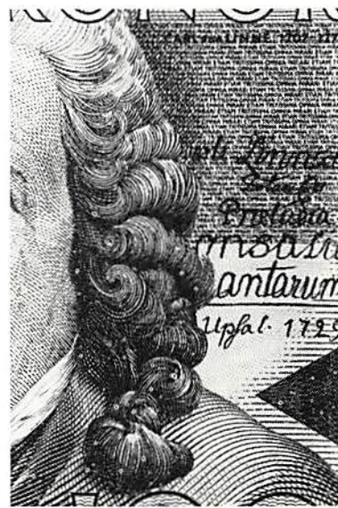
Fig. 2. Mikroskriften och den hemliga triangeln.

På baksidan finns också till vänster ett pollenkorn och märkesflikarna av en pistill i det guil-