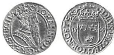
Fig 10. Johan III, krongyllen 1569.

Kanske bör det nämnas, att Ahlströms auktion även omfattar en "vanlig" avdelning med fint svenskt material (t.ex. Johan III:s krongyllen i 01), bra danskt, norskt och antikt samt en del annat utländskt.