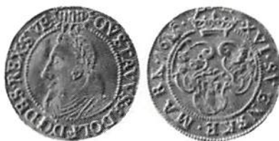
Fig 3. Gustav II Adolf, 16 mark (gulld) 1615.

De förens svenska besittningarna runt Östersjön och längre ner i Tysk-