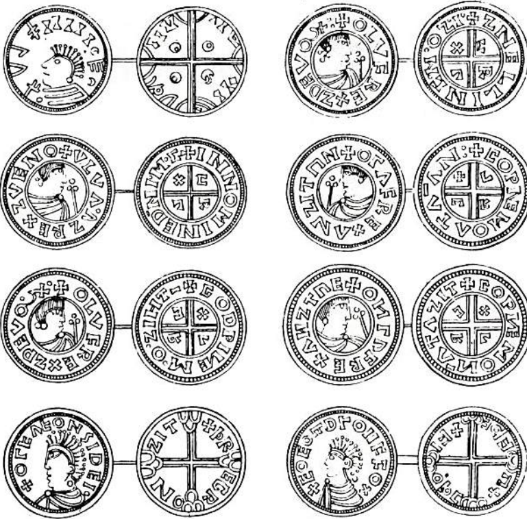
Kopparstick ur Elias Brenner, Thesaurus nummorum , 2:a uppl. 1731, visande Tab. II med de i texten omtalade Olof Skotkonung-mynten från Sigtuna. Överst till vänster och nederst till höger avbildar han ett par imitationer av Ethelred II:s mynt, vars inskrifter är barbariserade. Teckningarna gjorda 1705.