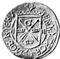
Gustav Eriksson, rundmynt 1522 med okänt värde (1/4 gyllen?). Silver, 7,30 g. Kungl. Myntkabinettet.