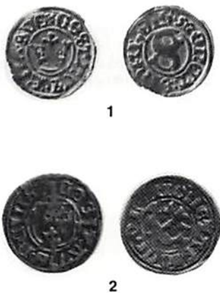
1. Gustav Vasas stockholmsfyrk u.å. av den typ som antas ha efterpräglats i Åbo och Reval 1523–1524.