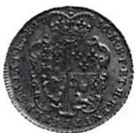
Fig. 6. Storbritannien, Georg II, 1 guinea 1736. Guld, 8,33 g. Detta mynt var värderat till 21 shillings.