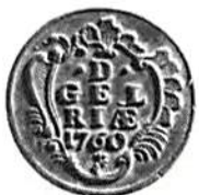
Fig. 9. Nederländerna, Geldern, kopparmynt om 1 stuywer 1760.