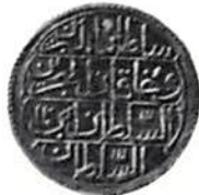
Fig. 8. Turkiet, sultan Abd ul-Hamid I, Konstantinopel, 1 sekin 1773. Guld, drygt 3 g.