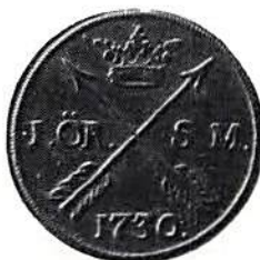
Fig. 14. Avesta, 1 öre s m 1730. Detta kopparmynt kallades också "slant", 2 öre s m "dubbel slant".