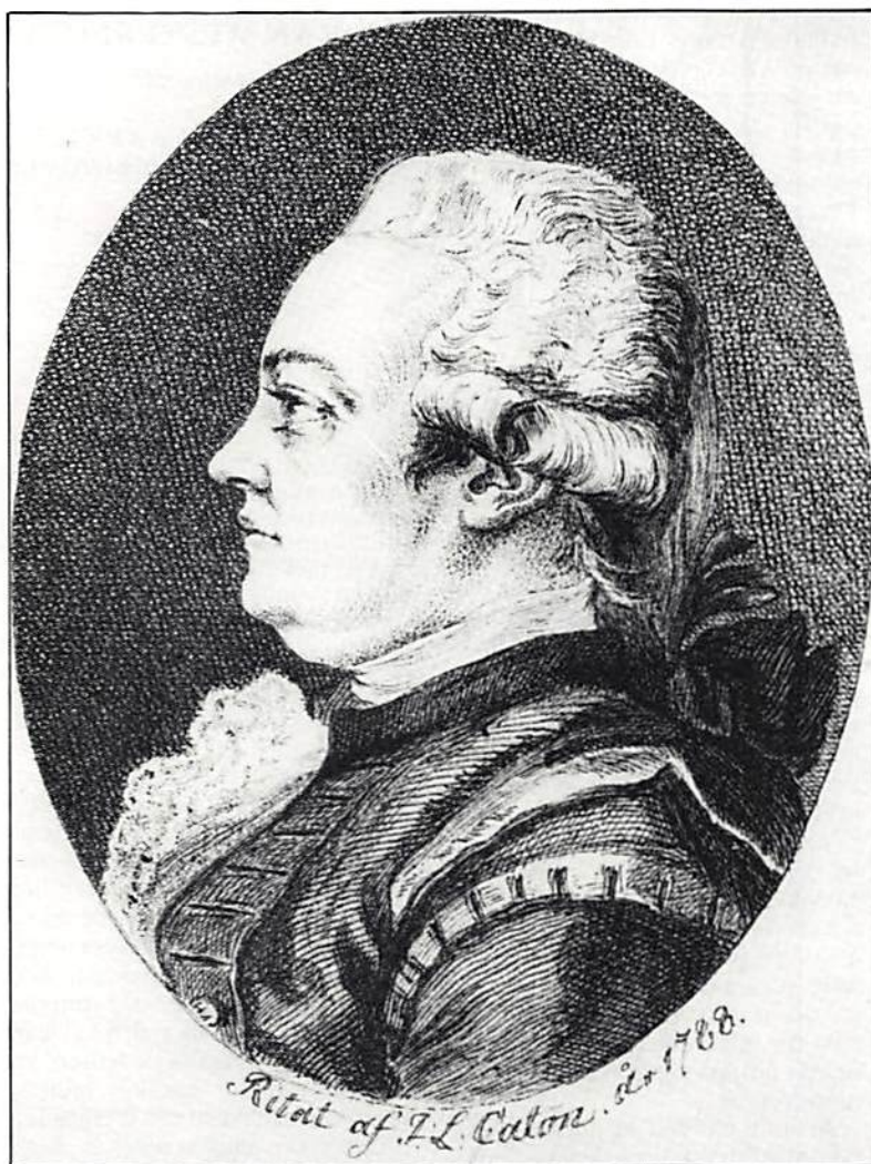
D. G. Nescher efter teckning (sedermåla använd för kopparstick) 1788 av J. L. Caton. Kungl. Biblioteket.

"Stämpel-verket, med därinnom varande sedel-tryckeriet, besågos då först. Efter fogad anstalt var allt på dessa ställen medelst flere arbetare uti full gång. Ganska fort och compendieust stämplades och trycktes där valeuren på många riksgälds-sedlar igenom prässverk, försedde med starka skrufvar och stora slagbomar af jern, med tunga kulor för ändarne, nästan på lika sätt inrättade som de, hvilka på Kongl. Myntet til präglingen nyttjas."