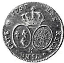
Fig. 7. Frankrike, Ludvig XV, dubbel louis d'or 1767. Guld, 8,16 g.