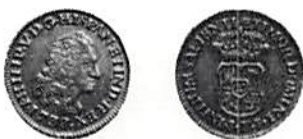
Fig. 4. Spanien (Kastilien), Filip V, 1 escudo 1738. Guld, 3,38 g.