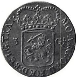
Fig. 5. Nederländerna, Utrecht, 3 gulden (3 floriner, 1 daalder) från slutet av 1700-talet.