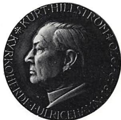
Kurt Hillström 1970. Medalj av Léo Holmgren. Kungl. Myntkabinettet.

Denna uppsats författade Torgny Lindgren för fyra år sedan men dröjde med att låta trycka, eftersom det ju inte varit möjligt att få något belägg för att dessa diplomater verkligen avlade det skildrade besöket. Författaren tänkte sig möjligheten av att Nescher haft något särskilt syfte med sin skildring, kanske politiskt; under allenastyrandets tid 1789-1809 rådde censur och för att undgå den måste man arbeta med så subtla medel, att deras eventuella syftemål undgår en sentida läsare.