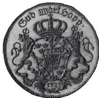
Riksdaler 1723 med Fredrik I:s bild och riksdaler 1727 med kungaparets bilder. Kungl. Myntkabinetet.