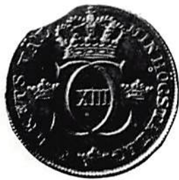
Kopparskilling 1816 (Karl XIII) med "mista".