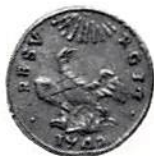
Fig. 10. Sicilien, Karl III, Palermo, 1 uncia d'oro 1742. Guld, 3,66 g.