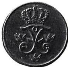
Fig. 12. a. 10 öre 1739, värderat till 12 öre, kallad "dubbel pjäs". b. 5 öre 1722, värderad till 6 öre och kallad "enkel pjäs" eller "pjäs". c. 1 öre 1731, även kallad "vitten" eller "styver". – Öresmynten i silver kallades också courantmynt. 32 öre i silver var = 1 daler courant.