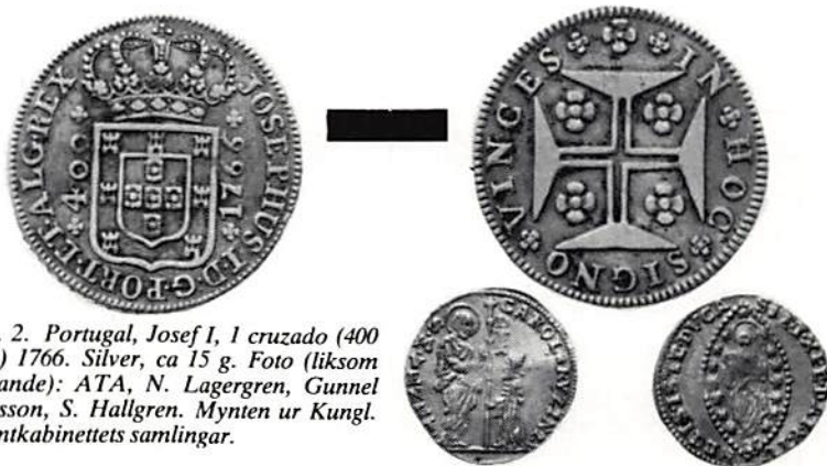
Fig. 2. Portugal, Josef I, 1 cruizado (400 reis) 1766. Silver, ca 15 g. Mynten ur Kungl. Myntkabinetets samlingar.

Några förklaringar beträffande utländska mynt och svenska mått: