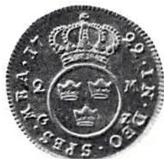
Fig. 11. Sverige, Fredrik I, 2 mark 1722, vanligen kallad 1 carolin. 2 caroliner eller 4 mark var = 1 daler carolin.