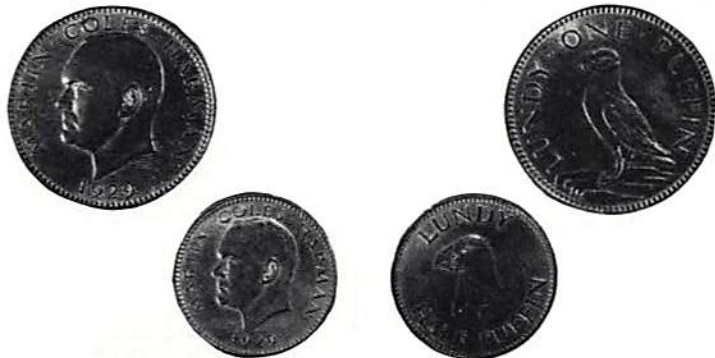
Lundy, 1 och 1/2 puffin 1929.