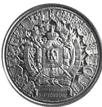
Allmänna världsutställningen för lantbruk, industri och skön konst i Paris 1855. Guld, 60 mm. Hyckert, Sveriges och Svenska konungahusets minnespenningar.... Stockholm 1892. Oscar 1, nr 2. Skala 4:5.

de förutom de stora dyra medaljerna köpa mindre minnesjetonger som ibland även ingick i biljettpriset. Vid många tillfällen präglades medaljer på själva utställningsplatsen.