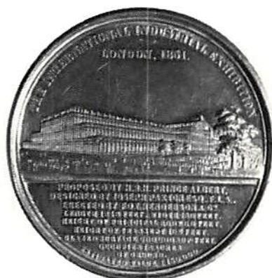
Den internationella industriutställningen i London 1851 av Allen & Moore. Tenn, 51 mm.