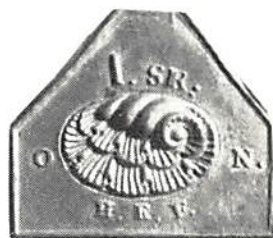
Pollett, Sabbatsbergs fattighusinrättning.

ende: Brakteatpräglad med sex sidor (30×35 mm). I mittpartiet en snäcka med I. SK. däröver. Vid sidorna O och N, samt nederst: H. E. F.