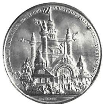
Allmänna konst- och industriutställningen i Stockholm 1897 av Lea Ahlborn. Silver (ovanlig i denna metall) 46 mm. Brita Olsén, Lea Ahlborn, Stockholm 1962, s 342