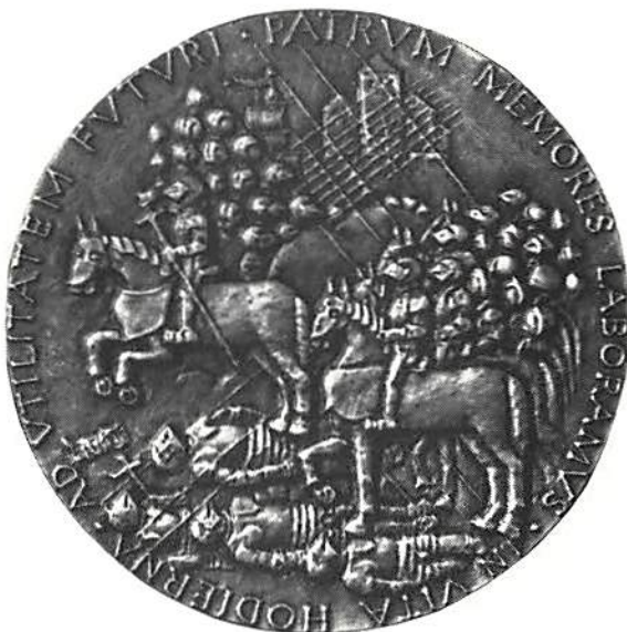
Åbo landskapsmuseum 100 år Foto Gunnel Jansson ATA. Tillhör Kungl Myntkabinettet.