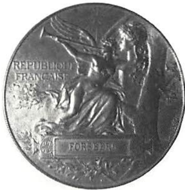
Världsutställningen i Paris 1889 av Louis Bottée. Brons, 63 mm. Skala 4:5.