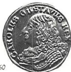
2 mark 1660

å Grand hotell i Borås lördagen den 20 mars kl 11.30–13.00 och 14.00–18.30.