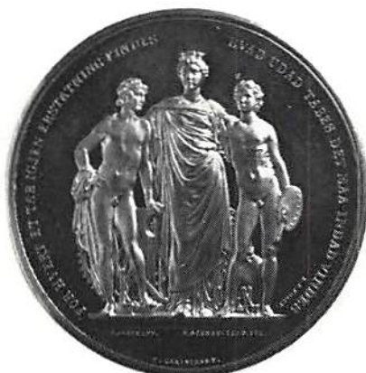
Den nordiska industri- och konstutställningen i Köpenhamn 1872 av F. Schmafelf. Tenn, 55 mm. Bergsøe. Danske Medailler og Jetons, Köpenhamn 1893, pl. XIII:30.