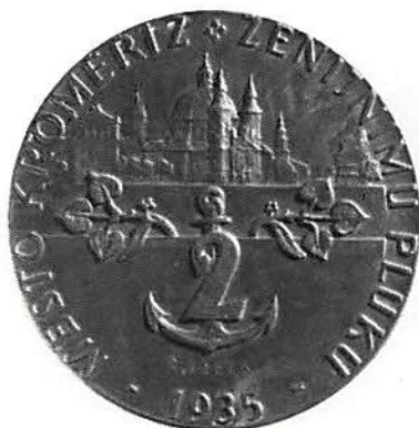
Slovakisk medalj från 1935.