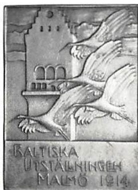
Baltiska utställningen i Malmö 1914. Brons, 50×37 mm.