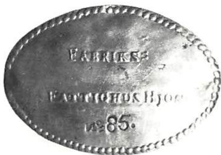
Fabriksfattighushjons bricka.

Vad var nu ett fabriksfattighusjon? Under tidigt 1800-tal steg fattigvårdskostnaderna enormt. En reaktion kom till uttryck i 1834 års fattigvårdslag, som bygger på det berömda kommittébetänkandet av 20 februari samma år. Genom 1834 års lag kom principerna för drottning Elisabeth I:s av England lag av år 1601 åter till heders. Det centrala inom fattigvården kom att bli fattigvårdsanstalten ("the workhouse"). Kontanta understöd erbjöds i form av intagande på fattigvårdsanstalt, där vistelsen genom inskränkning i friheten, arbetsplikt, enformig kost osv. gjordes mindre tilldragande.