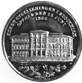
Stockholms-Industri- och Konstutställning 1866. Britannia-metall, 36 mm. Medaljen såldes i en dosa av mässing. Hildebrand, Sveriges och Svenska konungahusets minnespenningar... II, Stockholm 1875, Carl XV, nr 14.