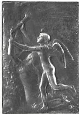
Världsutställningen i Paris 1900 av O. Roty. Silver, 51×36 mm.