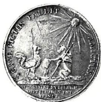
Medalj från Trettioåriga kriget, kanske slagen i Erfurt för att erinra om fördraget i Heilbronn och freden i Prag 1633 –35. Kungl Myntkabinettet.

vara en katolsk medalj riktad mot den svensk-franska alliansen i Bärwalde 1631, utan tvärtom en protestantisk (observera Jehovah-solen på åtsidan, aldrig använd av katoliker-na!), sannolikt tillkommen i Erfurt. Om den skall illustrera fördraget i Heilbronn 1633 och freden i Prag 1635, som författaren antar, vill fransidan varna för katolikerna (räven i munkkåpa), medan tuppen kan symbolisera enbart vaksamhet eller Sveriges allierade, Frankrike.