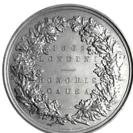
Världsutställningen i London 1862 av L. O. Wyon. Brons, 77 mm. Skala 4:5.