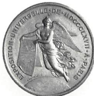
Världsutställningen i Paris 1867 av H. Ponscarne Brons, 51 mm Skala 4:5, Foto Juri Tamsalu, KMK.