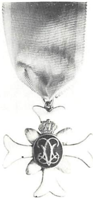
Ordensdekoration för Vadstena adliga jungfrustift. Den med kunglig krona förseddad mitskölden i blå emalj upptar Lovisa Ulrikas monogram. Dekorationen bärs i vitt band med ljusblå kanter. Privat ägo.

för landsorten aldrig blev utskickade. Kort därefter kom hattarnas krig med Ryssland 1741–43 och pengarna gick till viktigare göromål.