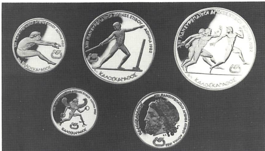
Nya grekiska samlarmynt