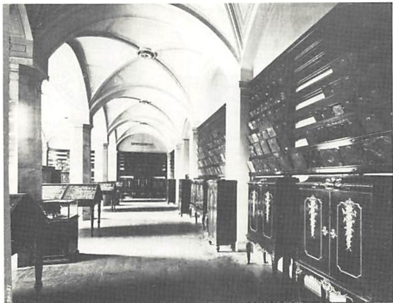
3. Interiør fra Kungl. Myntkabinettets udstilling i Nationalmuseet ved Blasieholmskajen i Stockholm.