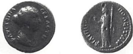
Fig. 3. Philippopolis, Faustina d.ä. (Köpenhamn)

I den reorganisation av det romerska väldet som kejsar Diocletianus (286–305) genomförde blev Trakien ett av de nybildade tolv förvaltningsområdena (dieceser). Folkvandringarna fortsatte och därmed nya strider. År 378 led romarna ett förintande nederlag mot västgoterna i förbund med alaner och hunner i slaget vid Hadrianopolis i sydöstra Trakien. Theodosius I ingick fredsfördrag med västgoterna några år senare och träffade överenskommelse med dem om deras bosättningsrätt inom det trakiska området. Anstormningen av västgoter, hunner och slaver fortsatte sedan under hela 400-talet. Som skydd mot huvudstaden Konstantinopel (nuvarande Istanbul) anlade Anastasius I en lång mur från Selymbria vid Marmarasjön till Derkont vid Svarta Havet. Kejsar Justinianus var den siste som allvarligt försökte försvara diecesen Tracia. Hans efterträdare förlorade alltmer greppet om provinsen och med bulgarernas invandring år 679 slutar trakernas historia. Det som fanns kvar av de trakiska stammarna gick upp i de nya befolkningsskikten.