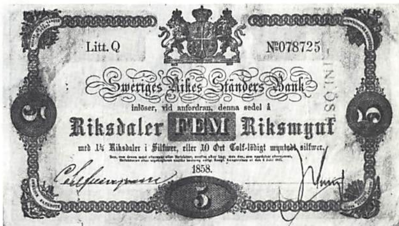
Ill. 1. Sedel å 5 riksdaler riksmünt med tidigare bottentryck

sedlar å 1 riksdaler riksmünt förfalskades till femriksdalersedlar. Detta problem dryftades av bankofullmäktige vid deras sammanträde den 22 september 1864. De konstaterade då, "att sedlar å 1 rdr med större lätthet kunde eftergöras till likhet med de sedlar å 5 rdr, hvilka äro