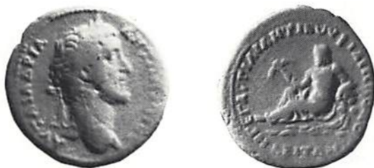
Fig. 2. Philippopolis, Antoninus Pius (138-161). (Köpenhamn)

I Historiska museerna (Narvavägen, Stockholm) pågår under tiden 6 september till 31 oktober 1980 en utställning om trakerna, ett folk som under antiken bodde i ett stort områ-