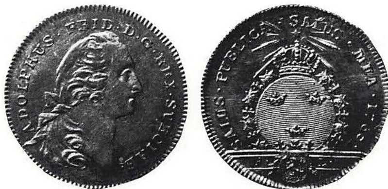
Fig 4. Samma som Fig 3 men förstörd.

I väntan på myndigheternas beslut rörande dessa nya nationaltillgångar blev gruvhålen tilltäppta med grästensblock. Till upptäckarna utbetalades rundliga kontanta ersättningar, liksom till jordägarna. Glädjen och förhoppningarna var så stora att också Swab, som ändå verkat å ämbetets vägnar, fick penningbelöning.