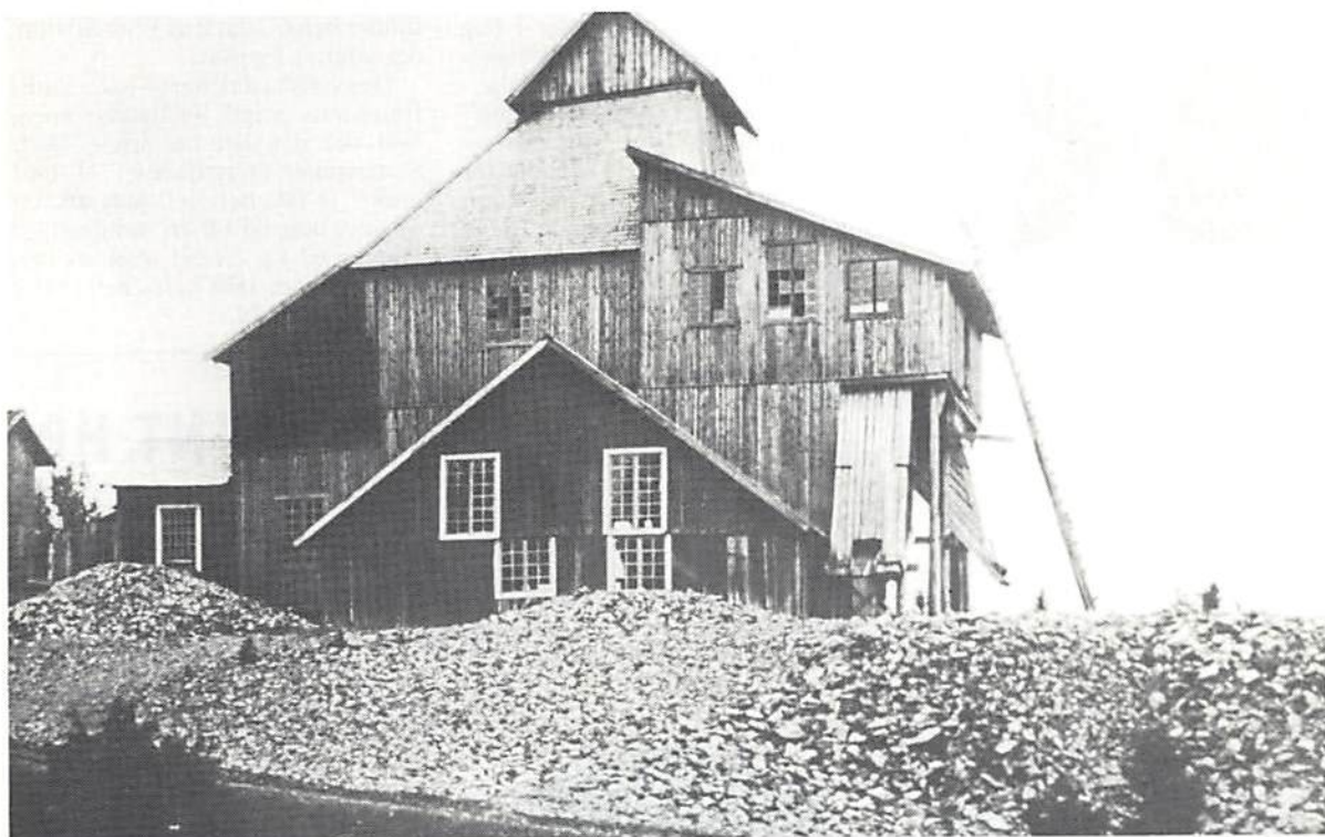
Fig. 1. "Vasken" vid Ädelfors guldgruva, nedlagd 1898.