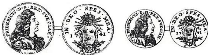
Fig 2. I Vetenskaps Akademiens Handlingar blev det nya svenska guldets beskrivet och dess präglade produkter vederbörligen avbildade i kopparstick.

Skylten eller Cartouchen Smäländska Wapnet, som af hogsående ritning närmare kan ses.