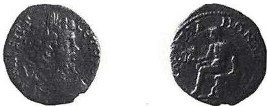
Fig. 6. Anchialos, Septimius Severus (197-211). (Stockholm)

bära tillnamnet Ulpia, kejsarens familjenamn. Den viktigaste delen av Trakiens mynthistoria under kejsartiden omfattar en tid av ca hundra år från 150 till 250 e.Kr., dock börjar den tidigare på en del håll. Vanliga motiv på mynten är de grekiskromerska gudarna och halvgudarna och personifikationer av det slag som i riklig mängd finns på romerska riksmünt. Bland dessa märks ett stort antal flodgudar. Vidare finns mytologiska motiv och agonistiska, d v s sådana som syftar på städernas tävlingsspel och idrottsfester. Därtill kommer motiv som hör ihop med kejsaren och kejsarkulten samt arkitekturmotiv, ibland utformade som hela stadsvyer.