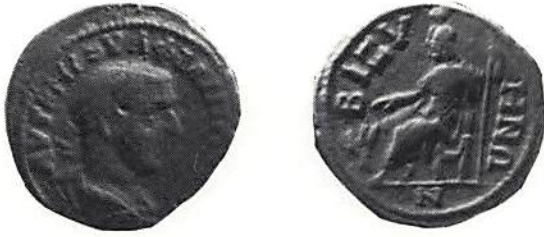
Fig. 10. Bizye, Filip I (244–249). (Köpenhamn)

Under 200-talet blev främmande gudar som Sarapis, Isis och Kybele populära. De kom alla österifrån. Ett mynt från Bizye (det moderna Vize) i sydöstra Trakien inte långt från Svarta Havet har på åtsidan ett porträtt av Filip I (238–244) och på framsidan den tronande Sarapis. Han bär på huvudet ett kornmått, modius, och har vid fötterna den månghövdade hunden Kerberos, som vaktade ingången till Hades (fig 10). Av halvgudarna är Herakles den viktigaste. Ett mynt (fig 11) från Hadrianopolis, beläget där floderna Hebros och Tonzos flyter samman,