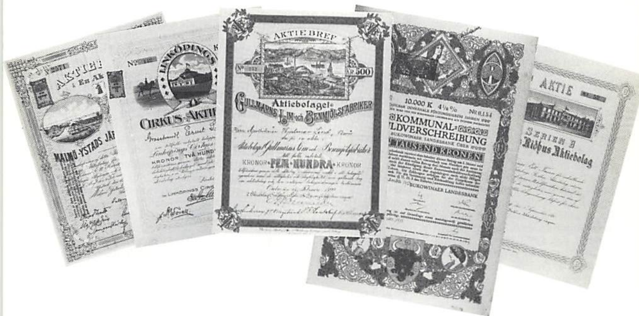
En bukkett aktiebrev ur Bankmuseets, KMK, samlingar.