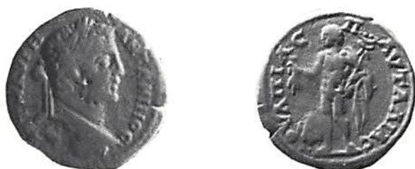
Fig. 7. Pantolia, Caracalla (211-217). (Köpenhamn)

prägling började tidigare i Filippopolis än i de flesta andra trakiska städer, redan under Domitianus (81-96). Motiven är varierande och hör till de grupper som nämnts ovan. Floden Hebros, personifierad av flodguden med samma namn, förekommer ofta som här på ett mynt från Antoninus Pius (138-161), vars porträtt ses på åtsidan (fig 2). Demeter, en av de oftast förekommande grekiska gudinnorna, ses på ett annat mynt från samma stad med ett vackert porträtt av Antoninus Pius gemål, Faustina d.ä., på åtsidan (fig 3). Demeter håller i höger hand sitt vanligaste attribut, några sädesax, och i den andra en lång fackla. Det stora myntet (fig 4) har på åtsidan ett