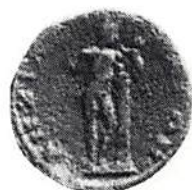
Fig. 8. Anchialos. (Berlin)

Av de grekiska gudarna är förutom Demeter många andra ofta avbildade på trakiska mynt: Zeus, Poseidon, Athena, Asklepios osv. Apollon som jämte Dionysos var Trakiens huvudgud, framställs ofta som bågskytt (fig 5). Hermes känns lätt igen på sina attribut, framför allt den s k Hermesstaven, kerykeion (latin caduceus). På mynten från Pautalia i västra Trakien och Anchialos i landets östra del (fig 6-7) ses han i två varianter, stående och sittande. Bägge framställningarna är av konventionellt slag. Intressantare är den typ, som avbildas i fig 8,