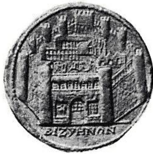
Fig. 12. Bizye, Filip I (244-249). (Berlin)