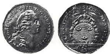
Fig 3. Smäländsk dukat 1765.

Några dagar senare uppsökte Stenborg bergmästare Swab i Kleva kopparverk och denne besiktigade det nya gruvhålet, som emellertid var fyllt med vatten. Dagen därpå, den 19 april, fick Swab av Stenborg en guldrök tuff och skickade den med en rapport till Bergskollegium. Sveriges första egentliga guldfyndighet var påträffad. I juli fann den nitiska Swab ännu en. Fyndplatserna i Ökna och Alseda döptes nu om till Kronoberget och Ädelfors.