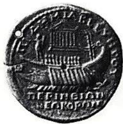
Fig. 14. Perinthos, Septimius Severus (197-211). (Stockholm)