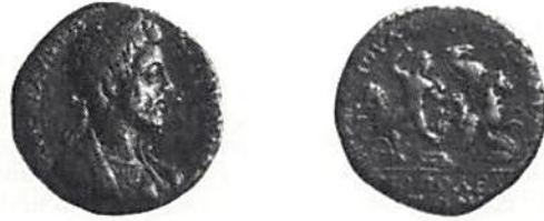
Fig. 11. Hadrianopolis, Commodus (180–192). (Stockholm)

Stadsvyer är kända från flera trakiska myntorter. En av de intressantaste kommer från den redan omnämnda staden Bizye och finns på ett mynt från Filip I (fig 12). Man ser stadsmuren byggd av regelbundna kvaderstenar och flera torn försedda med tinnar. Framtill i muren finns en port flankerad av torn. Innanför ses en anhopning av byggnader.