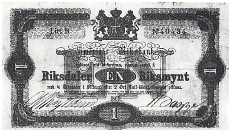
Ill. 4. Sedel å 1 riksdaler riksmünt med senare tryck

Källor: bankofullmäktiges protokoll, riksarkivet, Rb 156-159.