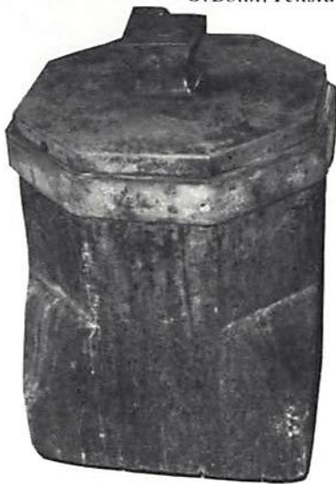
Klingningsstädet från Kungl Myntet i Stockholm