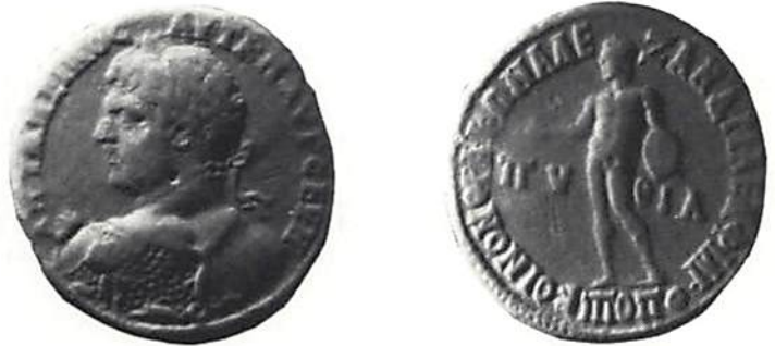
Fig. 4. Philippopolis, Caracalla (211–217). (Köpenhamn)

I provinsen Trakien växte städerna i betydelse under den romerska tiden. Till de få städer som fanns