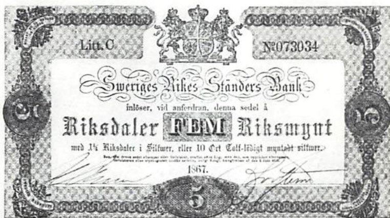
Ill. 2. Sedel å 5 riksdaler riksmünt med senare bottentryck

Vid detta tillfälle framhöll bankofullmäktige, att det var svårt att skilja mellan riktiga och eftergjorda sedlar, om sedlarna i cirkulationen var skrynkliga, smutsiga och slitna.