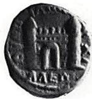
Fig. 13. Anchialos, Gordianus III (238-244). (Köpenhamn)

der, som troligen betecknar stadens torg. En annan stadsvy kommer från staden Anchialos vid Svarta Havet. Den visar en port krönt av ett galleri och omgiven av två kraftiga torn (fig 13). Anchialos var en gammal stad, vars murar besjungs av Ovidius i samlingen Tristia, som han skrev under sin landsflykt i staden Tomis, belägen ännu längre norr ut vid Svarta Havet.