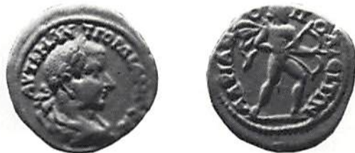
Fig. 5. Hadrianopolis, Gordianus III (238–244). (Köpenhamn)

tidigare kom en rad nya, grundade av romarna. I samband därmed byggdes vägnätet ut, vilket hade betydelse för försvaret och även underlättade den fredliga kommunikationen inom området. Städerna i det inre av Trakien upplevde sin blomstring under tiden från Trajanus (98–117) till Septimius Severus (197–211). Kejsar Trajanus var Trakiens främste välgörare. Ett flertal orter fick först då rang av stad och fick