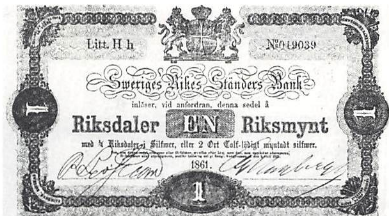
Ill. 3. Sedel å 1 riksdaler riksmünt med tidigare tryck

Det gröna bottentrycket har i midten bokstäfverna EN i guiljocheradt mönster, då deremot dessa bokstäfver saknas på de nuvarande sedlar-