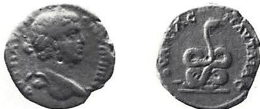
Fig. 9. Pantolia, Caracalla (211-217). (Köpenhamn)

ståtligt porträtt av kejsar Caracalla (211-217) och på fransidan en stående diskuskastare samt inskriften Pythia . Den visar att det är de pytis-