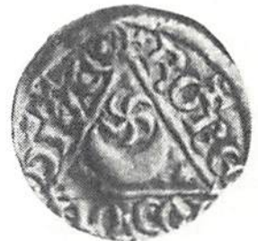
Fig 7. Skala 2x1.