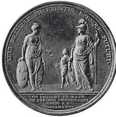
Ill 2. Rikets ständers medalj till minne av kronprins Gustav Adolfs examen 1786.