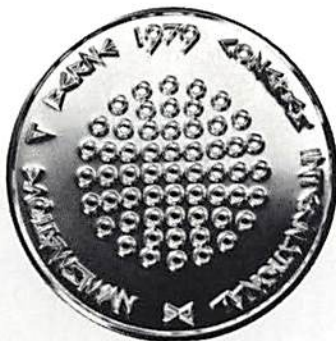
Kongressmedaljen av Max Bill

Den 9:e internationella numismatiska kongressen ägde rum i Bern den 10-15 september 1979 och upptog i sin deltagarlista 344 namn. Därtill bör tilläggas diverse anhängiga så det totala besökantalet översteg 400. Varje deltagare erhöll en diger portfölj med program, broschyrer och numismatiska småtryck.