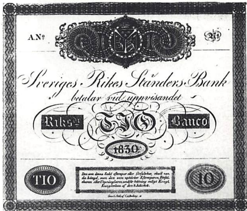
Ill 1a. Sedelförslag publicerat i Magasin för Konst, Nyheter och Moder .

na inte kosta, men kvinnan hade inte väntat på att få tillbaka vad hon hade betalat för mycket, utan hon hade tagit kläderna och skyndat ut. "Detta förhållande ansågs naturligtvis misstänkt, hvarföre den okända kvinnan eftersattes och ertappades samt blef till boden återförd. Sedeln granskades närmare och befanns vara utan allt värde. Den hade efter tryckt anteckning å baksidan tillhört sjetten årgången af magasin för konst, nyheter och moder och, efter hvad antagas kan,