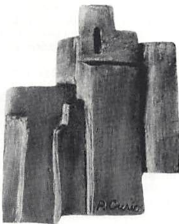
Parvine Curie, Frankrike: "Temple II". Medalj eller skulptur?