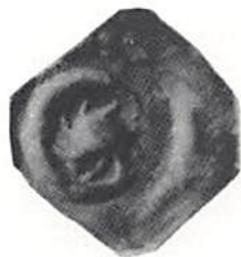
Fig 3. Skala 2x1.

Vad talar då för att typen är svensk? Oss veterligen har den aldrig påträffats utanför Sverige. Där emot kan den förväxlas med samtida norska mynt. Liknande brakteater präglades i vårt grannland under Håkon Håkonssons (1217–63) regering. Dessa mynt uppvisar dels sextill åttauddiga stjärnor med punkter mellan strålarna, utan månskära (Fig 2), dels en typ med en månskära som nästan omsluter en betydligt mindre stjärna – eller snarare sol, eftersom dess strålar ej pekar rätt ut utan är något svängda, samtliga i samma riktning (Fig 3). 3 Medelvikten för dessa brakteater ligger strax över vår typs värden, 0,14–0,12 g, och silverhalten i de säkert norska mynten från denna tid är mycket låg, ca 25–30%. Halten i vår brakteat är visuellt hög; den synes vara jämförbar med de vanligaste brakteattyperna i Styrafyndet, de med antingen krönt, framvänt huvud eller lejonhuvud åt höger eller vänster inom slät ring (Fig 4–5). Haltanalyser av dessa typer har givit värden kring 800–825/1000. 4