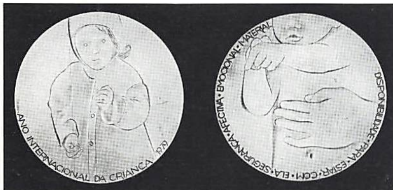
Den segrande Barnårsmedaljen av Helder Baptista.