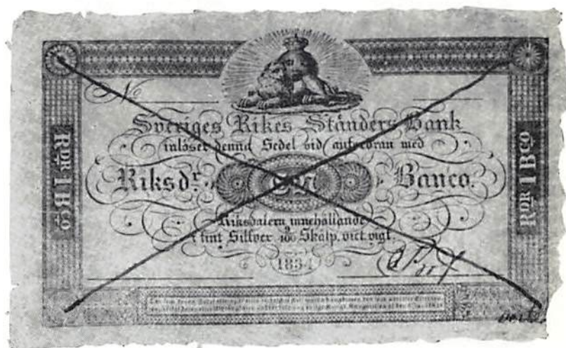
Ill 2. Provsedel på 1 riksdaler banko.