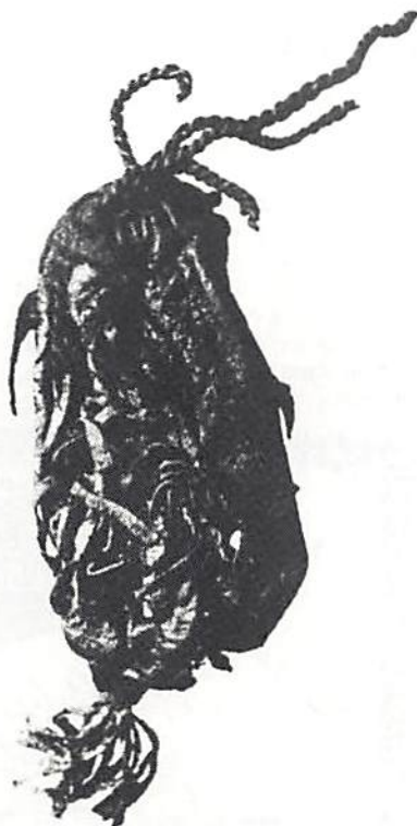
4. Penningpung påträffad 1960 i Överberg, Sveg, Härjedalen. Kungl. Myntkabinettet.

snörd, tyvärr helt förmultnad pung. Undersökningen av Korsbetningsgravarna från 1361 vid Visby resulterade som bekant bl a i att några ytterst viktiga myntfynd gjordes; ett av dessa förvarades i en delvis bevarad pung, av allt att döma av samma typ som det här behandlade, 300 år yngre (Bengt Thordeman: Myntfynden i Korsbetningens massgravar, Fornvännen 1932, fig. 26. En liknande – utan mynt men bättre bevarad – som påträffats vid Stora Nygatan i Stockholm avbildas av honom som fig. 27). 1960 inlöste Kungl. Myntkabinettet en vid sprängning i Överberg, Sveg, Härjedalen, framkommen sämskskinnspong och ett i denna förvarat mynt, ett kopparöre 1639 (Nils Ludvig Rasmusson: Kungl. Myntkabinettet, Stockholm 1960, Nordisk numismatisk årsskrift 1961, s. 177). Den är tyvärr skadad, men efter konserveringen kan man se, att den är prydd med fransar av läder. Snörningen upptill är bevarad, medan botten är trasig, fig. 3. Dess utförande är något mera påkostat