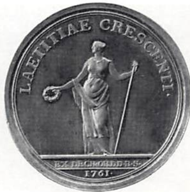
Ill 1. Rikets ständers medalj till minne av kronprins Gustavs 15-årsdag 1761.