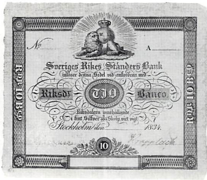
Ill 4. Provsedel på 10 riksdaler banko.