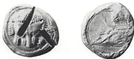
Fig 1. Sicilien, Zankle, tetradrachm 494-490 f Kr. Från Assiut fyndet, nu i Kungl Myntkabinettet, Stockholm.

Försöksmetoden består i att med största precision, mynt för mynt, bestämma halten av olika blyisotoper i myntsilvret. Sedan kommer turen till silvergruvorna. I enlighet med sin geologiska förhistoria härskar i varje gruva en alldeles bestämd och endast för denna fyndort karakteristisk blyammansättning. Man kan alltså genom jämförelse av