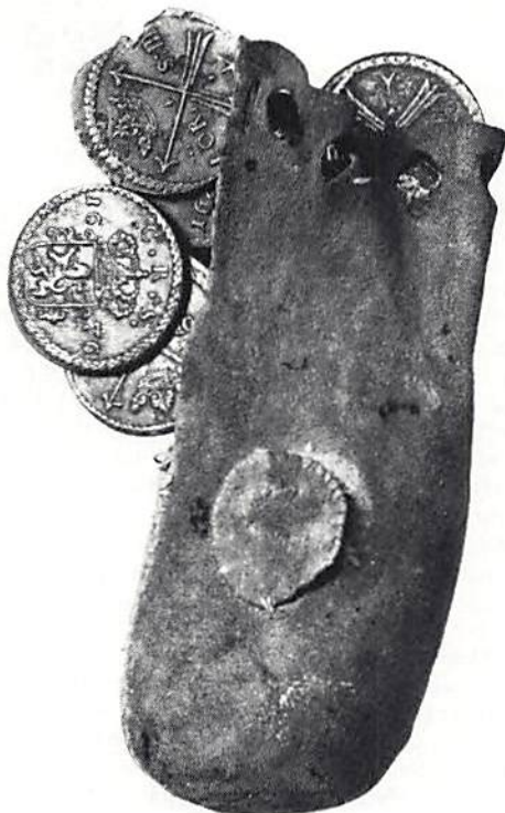
1. Penningpung av sämskskinn, förvarad i Häradshammars kyrka, Östergötland, och några av mynten i denna.

*16. Som föregående. En liten halvmåneformig bit saknas nedtill (räknat på åtsidan). Detta förekommer ofta på valsverkspräglade mynt, beroende på oskicklighet eller sparsamhet vid utskärningen av det närmast föregående myntet på det färdigpräglade bandet och fram-