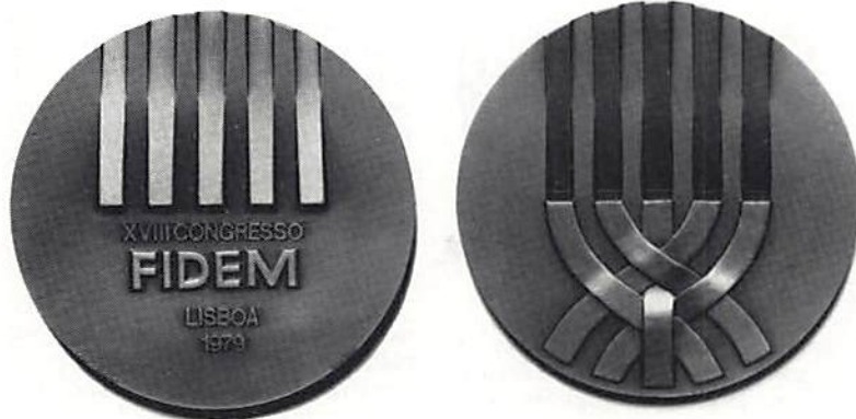
Kongressmedaljen av José Candido, Portugal.