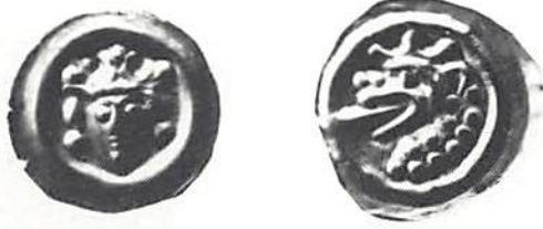
Fig 4-5. Skala 2x1.

landsmynten från första halvan av 1200-talet ligger mellan 0,11 och 0,17 g; det förstnämnda värdet finner vi bland det tidiga 1200-talets myntgrupper, medan de senare har en högre medelvikt. Ett baltiskt ursprung för stjärna/månbrakteaten kan uteslutas, då detta områdes präglingar (också representerade i Styraskatten) vikts- och storleksmässigt samt tekniskt saknar all anknytning.