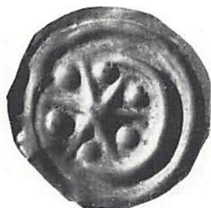
Fig 1. Skala 3x1.

Den svenska myntserien är endast delvis grundligt genomforskad, liksom många andra områden inom numismatiken. Ett ständigt arbete pågår emellertid för att täppa till de luckor som finns. Sålunda är t ex avdelningen Sturetiden i projektet Sveriges Mynthistoria nu i slutfasen. Kartläggningen av vikingatidens mynt har pågått länge och inom nyare tidens serier forskas i plåtmyntningen och i Karl XI:s mynt, för att nämna några exempel. Under det fortsatta forskningsarbetet kommer säkerligen nya viktiga upptäckter att göras i form av helt nya typer, årtal och varianter.