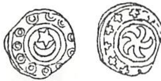
Fig 6. Skala 1x1.

De troligen äldsta mynten - de båda från Götaland - är mycket slitna eller skadade, vilket tyder på att de cirkulerat en viss tid innan de anförtrötts åt jorden. De gotländska myntens dominans i den lilla skatten är ej märklig, då Halltorp endast ligger drygt ett par mil söder om Kalmar. Tyvärr är dateringen av dessa präglingar ej fullt säker; den som här angivits skall ses med reservation. Förslagsvis vill vi dock förlägga skatten, och därmed också vår brakteattyp, till senast 1230-talet.