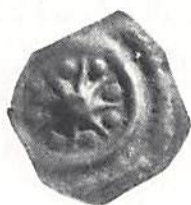
Fig 2. Skala 2x1.

Typen synes ha framkommit för första gången i och med påträffandet av den stora myntskatten från Styra i Östergötland år 1786. I en förteckning över skatten, upprättad av Jacob von Engeström strax efteråt, beskrivs typen med kommentaren att "deraf sågs 3 st" 2 . Märkligt nog tycks dock von Engeström ej ha observerat månskäran vid sidan av stjärnan. Den teckning av typen som beledsagar hans manuskript är dock ej helt tydlig; ena kanten av myntet är diffust framställd. Möjligen kan just det exemplaret ha varit skadat eller dåligt utpräglat på det ställe där månskäran normalt befinner sig. I så fall borde han emellertid ha observerat den detaljen på något av de andra två exemplaren. Ett exemplar i Kungl Myntkabinetet härstammar med största sannolikhet ur Styraskatten, liksom ett privatägt mynt (Fig 1. 0,12 g). Båda exemplaren uppvisar samma, för fyndet karakteristiska ljusgröna patina. De övriga undersökta exemplaren framkom år 1951 vid undersökningar av Halltorps kyrka i Småland, ett i form av ett lösfynd (skadat) och de övriga ingående i en liten skatt. Då vi ej har eftersträvat att kartlägga samtliga kända exemplar kan dock fler komma att upptäckas i offentliga och privata samlingar.