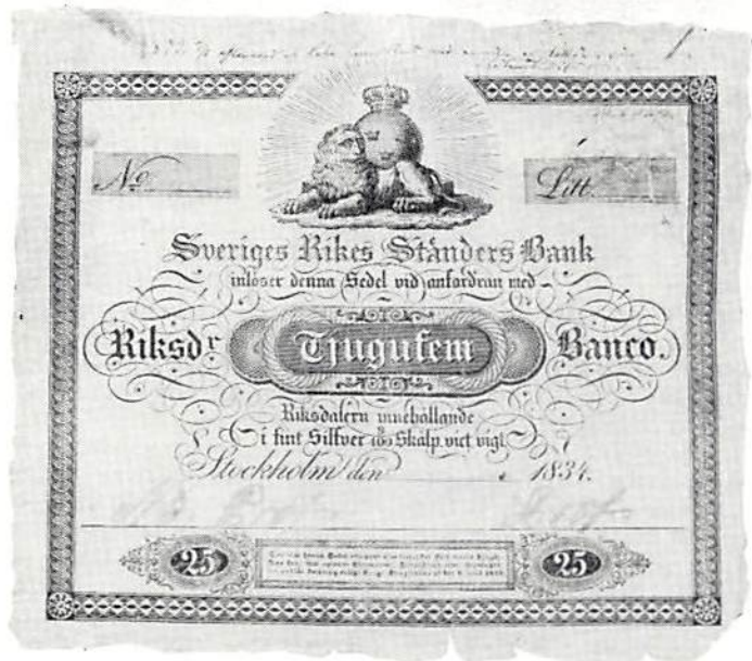
Ill 3. Lisa Lundstedts sedel.