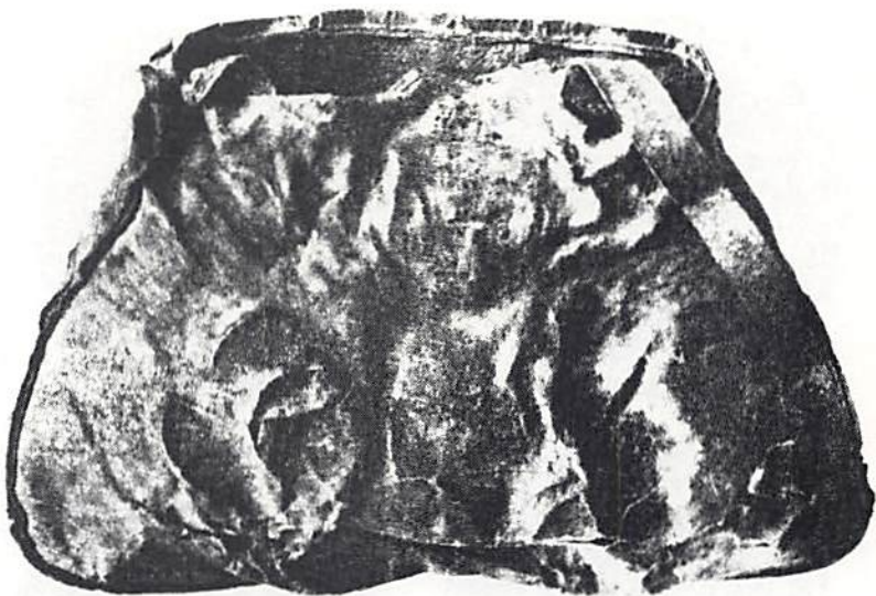
3. Penningpung av väskliknande typ, sannolikt från Gotland och daterad till 1700-talet. Den innehöll 108 st. 2 öre s.m. 1746–1768. Privat ägo.

Alltför vittgående slutsatser enligt "Thordemans lag" kan inte dras av detta material. Det är dock intressant att åren 1755 och 1757 helt