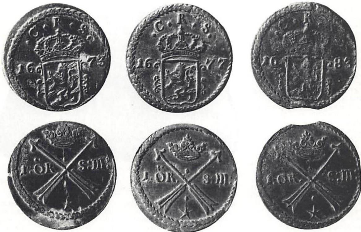
2. Några av de kopparmynt (1 öre s.m. från Karl XI) som låg i pungen från Häradshammars kyrka.