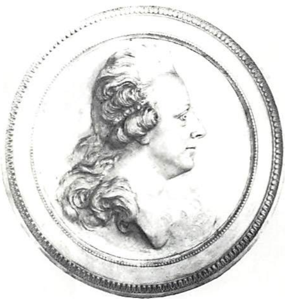
Fig. 2. Gipsmedaljong med Gustav III:s porträtt, förlaga för många medaljer. Av Johan Tobias Sergel, signerad 1779. Nationalmuseum.