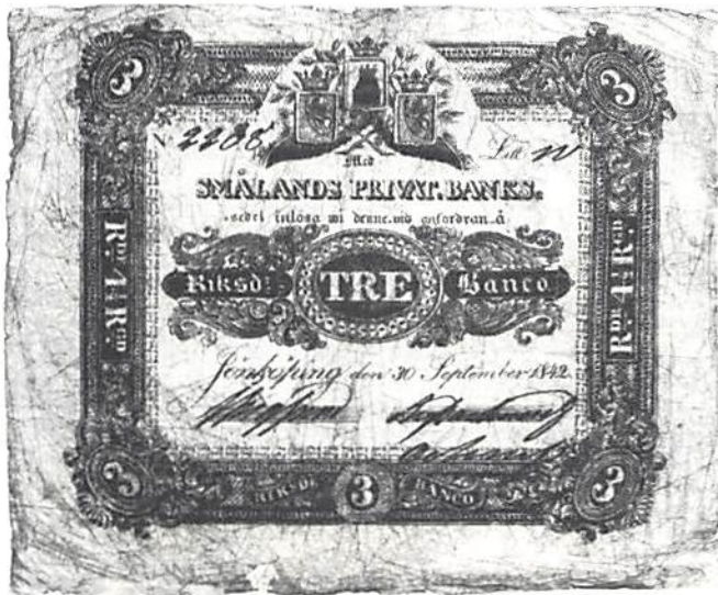
Fig. 2. Westerdahls färdiga "sedel" å 3 rdr bo.