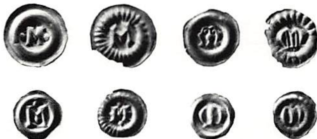
Fig. 1. M-brakteater från Magnus Ladulås 1275-90.

Denna översikt visar, att vissa bokstäver kommer igen i flera grupper, medan andra bara förekommer en eller två gånger. Är inte detta något som kan ge en fingervisning – men vilken? Även om vi eliminerar de bokstäver, som kan syfta på myntherren eller en ort, återstår flera att förklara. Det bör ju gå att med hjälp av skatter och lösfynd göra en karta över bokstävernas förekomst i olika delar av vårt land. Jag vågar gissa, att man då kan iaktta en viss geografisk fördelning, eftersom de dåliga kommunikationerna bör ha bidragit till att många av mynten fick lokal användning. Är så fallet, har vi kommit en bit på väg. Om t ex S förekommer på mynt med anknytning till Skänninge, Skara eller Stockholm, eller A kring Västerås, har vi kommit en bit på väg. När man går till Magnus Erikssons sista tvåsidiga, mycket stora myntning är väl