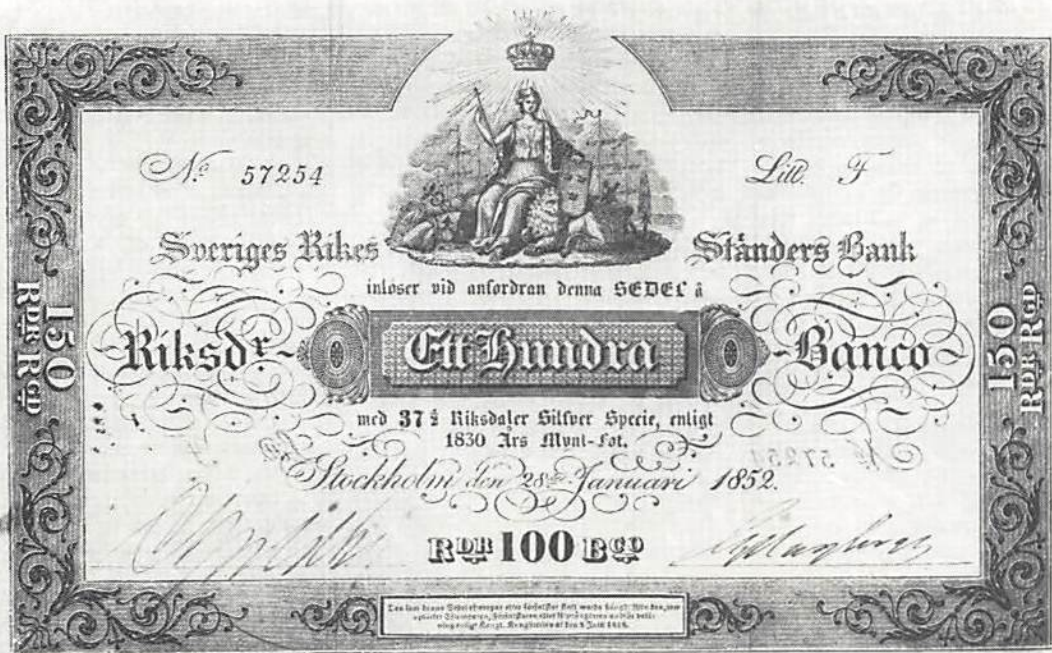
Fig. 1. Sedel å 100 riksdaler banco av den typ som infördes den 5 mars 1836. Denna sedel nominal var tryckt på gult papper; därför kallas den i tidningsnotisen för Guldfink. Skala 1:2.