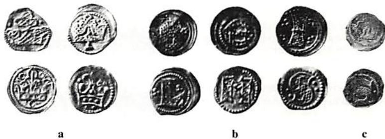
Fig. 2. Tvåsidiga mynt slagna under Birger Magnusson (1290–1319), de med M kanske tidigare. a. åtsidor, b. frånsidor, c. 1/2-penning