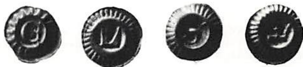
Fig. 5. Brakteater från Magnus Eriksson, visande bokstav eller krona inom strålring och slagna ca 1354-63. Låg silverhalt

Grupp XXVIII (fig 5) omfattar brakteater med strålring och de är kända med bokstäverna E, L och S samt krona (de med A, O, W eller I,