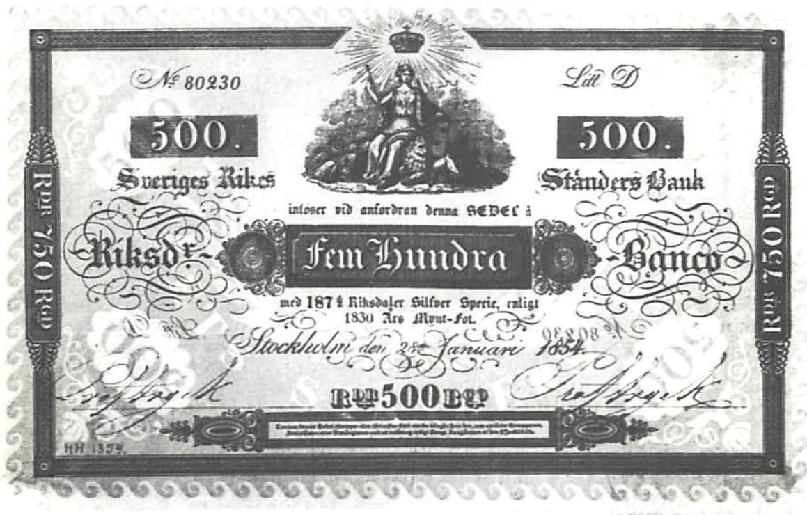
Fig. 2. Sedel å 500 riksdaler banko av den typ som infördes den 5 mars 1836. Denna sedelnominal var tryckt på blått papper; därför kallas den i tidningsnotisen för Fågel Blå . Skala 1:2.