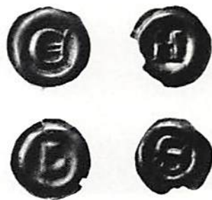
Fig. 6. Brakteater med bokstav inom slät ring och av gott silver, präglade från 1363

sätta de låghaltiga, inflationsdrivande mynten av grupp XXVIII. Vad hade hänt undet mellanåren? Efter förlusten av skånelandskapen bröts förlovningen mellan Håkan och Valdemar Atterdags minderåriga dotter Margareta (de gifte sig dock 1363). I stället trolovades Håkan med grevinnan Elisabet av Holsten. Vid detta tillfälle (juni 1361) lämnade Magnus och Håkan gemensamt Kalmar stad och län och myntverk som förläning till hennes far och farbror. Grevarna behöll det även efter det att förlovningen brutits och Håkan gift sig med Margareta i Köpenhamn. Dessförinnan hade emellertid de missnöjda stormännen förmått Håkan att tillfångata sin far Magnus; det skedde hösten 1361 i Kalmar stadskyrka. I februari 1362 hyllades Håkan som konung av Sverige. Han försonade sig med fadern och på sommaren gjorde de ett misslyckat försök att återta Skåne. De måste sedan sluta fred med Valdemar för att få stöd mot de svenska stormännen. En grupp bland dessa begav sig till Tyskland och hyllade Albrekt d y av Mecklenburg som svensk kung. Innan denne i november 1363 landsteg i Sverige hade Kalmar (på sommaren) gått över till honom. Mynten av grupp XXX erbjuder alltså ett intressant mynt-rättsligt problem. De började präg-