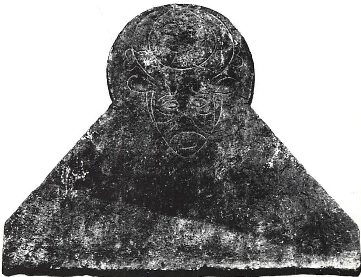
Fig. 7. Gravsten över hertig Erik Albrektsson (död 1397 på Klinteholm, Gotland) i Mariakyrkan, Visby.

Kort efter 1365 fick Albrekt dessutom en bättre kontroll över Kalmar genom att de holstenska grevarnas panträtt övergick till