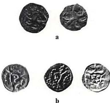
Fig. 3. Tvåsidiga penningar från Magnus Eriksson ca 1340–50. a. åtsidor, b. frånsidor

Han har just använt den metod Nathorst-Böös efterlyser, dvs en genomgång av samtliga kända skatt- och lösfynd; de senare, som ju säger mest om cirkulationen, finns också redovisade med sina fyndplatser på ett antal kartor, en för varje frånsidesbokstav. Han framhåller dock den utjämnande effekt som cirkulationen under ett eller ett par decennier måste ha haft. Givetvis har också myntens kron-typer, bokstavsbilder, bitecken m m undersökts och de redovisas utförligt, liksom vikt och förekomsten av stampkopplingar; existensen av dylika kopplingar har tidigare inte utforskats vad beträffar våra medeltida mynt (men pågår nu inom Kungl Myntkabinettet inom projektet Sturetidens mynthistoria ). Många intressanta slutsatser har kunnat dras och givetvis har också