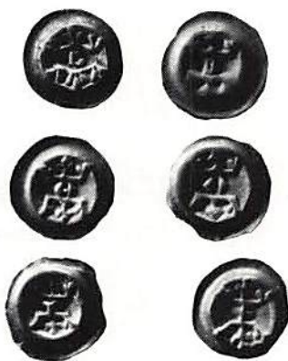
Fig. 4. Brakteater med motställda kronor, slagna under Magnus Eriksson ca 1350

Under betoning av att det endast rör sig om hypoteser, vars underbyggnad inte alltid är så stark på grund av otillräckligt material o dyl, har Jonsson föreslagit följande tolkningar av frånsidornas bok-