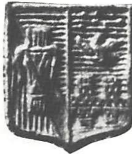
Fig. 1. Överst åt- och fränsida av 1876 års guldkrona med mm S.T., därunder åt- och fränsida av samma års guldkrona med mm E.B. Förstoring ca 2:1. Underst hjärtskölden till sistnämnda mynt i förstoring ca 10:1. De avbildade exemplaren i Kungl Myntkabinettet.

Svenska Numismatiska Föreningen, konstaterat, att någon mittsköld inte finns på de guldmynt, som präglats enligt 1873 års myntordning, ställer han till Kungl. Maj:t en den 11 mars 1874 inkommande skrivelse, där det heter: 2