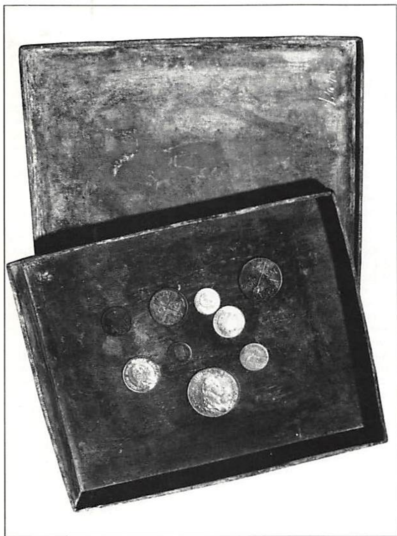
Grundläggningsdeponerat från forna Artillerikasernen i Göteborg. Blylådans storlek låter förmoda att den förutom mynten innehållit tidningar eller andra akter som helt förintats.

Det mynt i den deponerade serien som bär det senaste årtal, har präglats 1792. Det är riksdalern. Härav kan man troligen sluta att grundläggningen och depositionen ägt rum detta år. Kasernens egentliga byggnadsår är likväl, som man brukar ange, 1793.