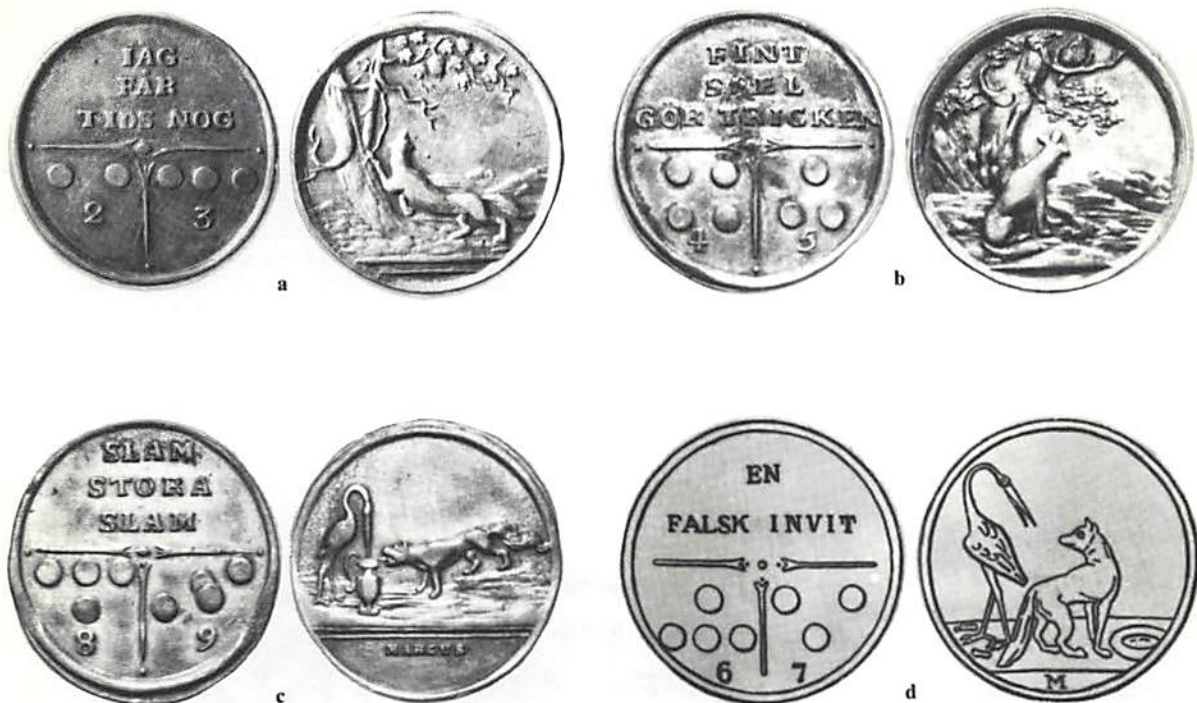
Fig. 4. a-d. Spelpenningar (förstorade) med 25 mm diameter, graverade av Moses Marcus, sannolikt på 1820- eller 30-talen, och med tyska förebilder. Troligen är de slagna hos en knappfabrikant eller metallverkstad i Stockholm. Foto: L-I Jönsson. Numismatiska Litteratursällskapet i Göteborg (b-d) och ATA (a). Observera att c är en tecknad rekonstruktion av G Holst; något exemplar är numera icke känt. a. tillhör Kungl Myntkabinetet

att tidfästa de fyra andra arbeten han signerat. Det rör sig om spelpenningar med 25 mm diameter, alla mycket sällsynta, vilket tyder på en liten upplaga (fig 4a-d).