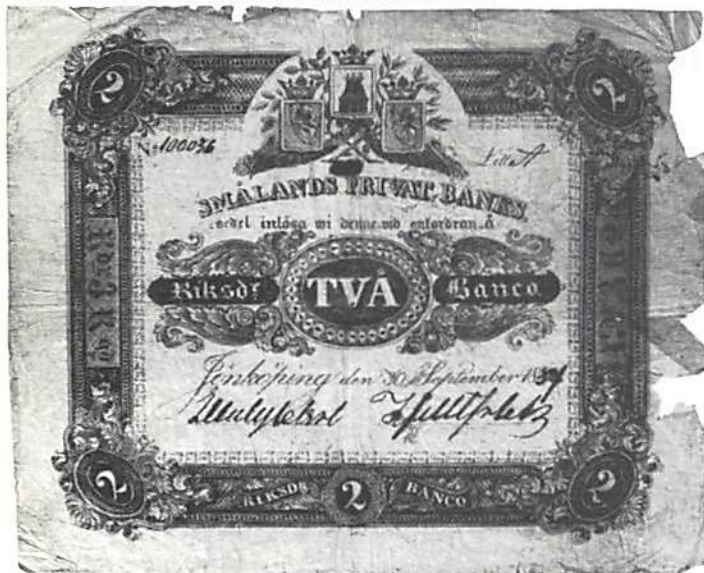
Fig. 4. "Med" utskrapat och 1842 ersatt med 1837.