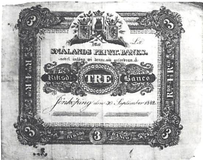
Fig. 1. Westerdahls blankett till "sedel" å 3 rdr bo.

Westerdahl fann det nu lämpligt att avlägga full bekännelse. Han hade haft många medhjälpare. Blanketterna var tillverkade av stentryckaren J Petersson i Karlskrona, som hade ritat dem på sten och tryckt dem på vitt postpapper i hela ark, med fyra blanketter på arket. Blanketterna hade i Karlskro-