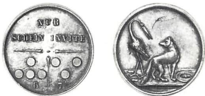
Fig 5. Tysk spelpenning från 1800-talets början, slagen av firma Loos i Berlin. Denna och tre andra var förebilder till dem som avbildas som fig 4.

H. Valentin : Judarnas historia i Sverige. Stockholm 1924.