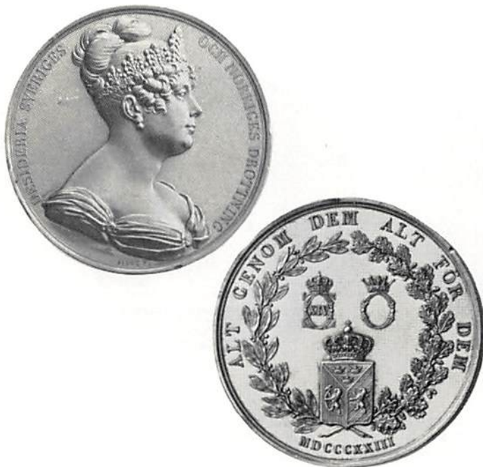
Ill. 3. Drottning Desideria. Av J. J. Barre. Hild. nr 1.

Drottningens kröning 1829. Av L. P. Lundgren. Hild. nr 4.