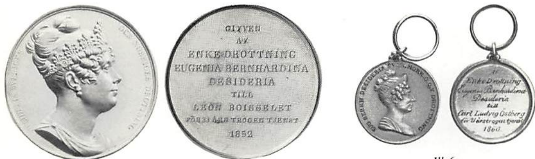
Ill. 5. Belöningsmedalj utdelad 1852. Åtsidan av J. J. Barre. Hild. nr 5.