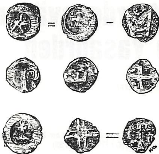
Några av mynten i Ulricehamns-fyndet, danska s.k. borgarkrigsmynt av nästan ren koppar. 1200-1300-talet. Tillhör Länsmuseet i Skara. Efter tuschteckn. av förf. år 1929.

Förutom de 20 borgarkrigsmynten förekom i Ulricehamns-fyndet ytterligare ett främmande mynt, en Visbyörtug, en s.k. gote. Detta ger fyndet smak av de sensationella myntfynden i Korsbetningsgraven vid Solberga forna kloster utanför Visby stadsmur, vårt bäst daterade myntfynd. Här vilar de gotländska och danska krigare, som stupade i Valdemarslaget den 27 juli 1361. En av krigarna — givetvis dansk — hade fått med sig sin penningpung. Den innehöll 25 borgarkrigsmynt samt därtill små svenska bokstavsbrakteater, bl.a. sådana med L inom strålkrets, som präglats i Lödöse. Liknande brakteater med krona, S eller E förekom jämte sådana med motställda kronor. Alla dessa mynt är ju svårbestämbara, då de är nästan inskriftlösa. Men genom