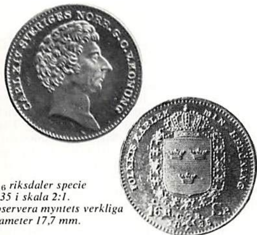
\frac{1}{16} riksdaler specie 1835 i skala 2:1. observera myntets verkliga diameter 17,7 mm.