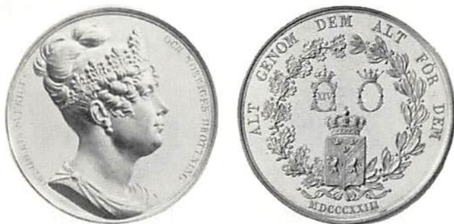
Ill. 4. Drottning Desideria. Av J. J. Barre. Hild. nr 2.