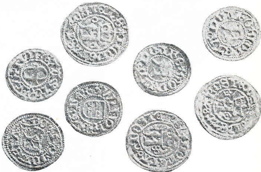
Olika mynttyper ur silverskatten från Västerås. Märkningen

jämförelser. Man kan jämföra dåtidens löner med nutidens. En (forts. sid. 14)