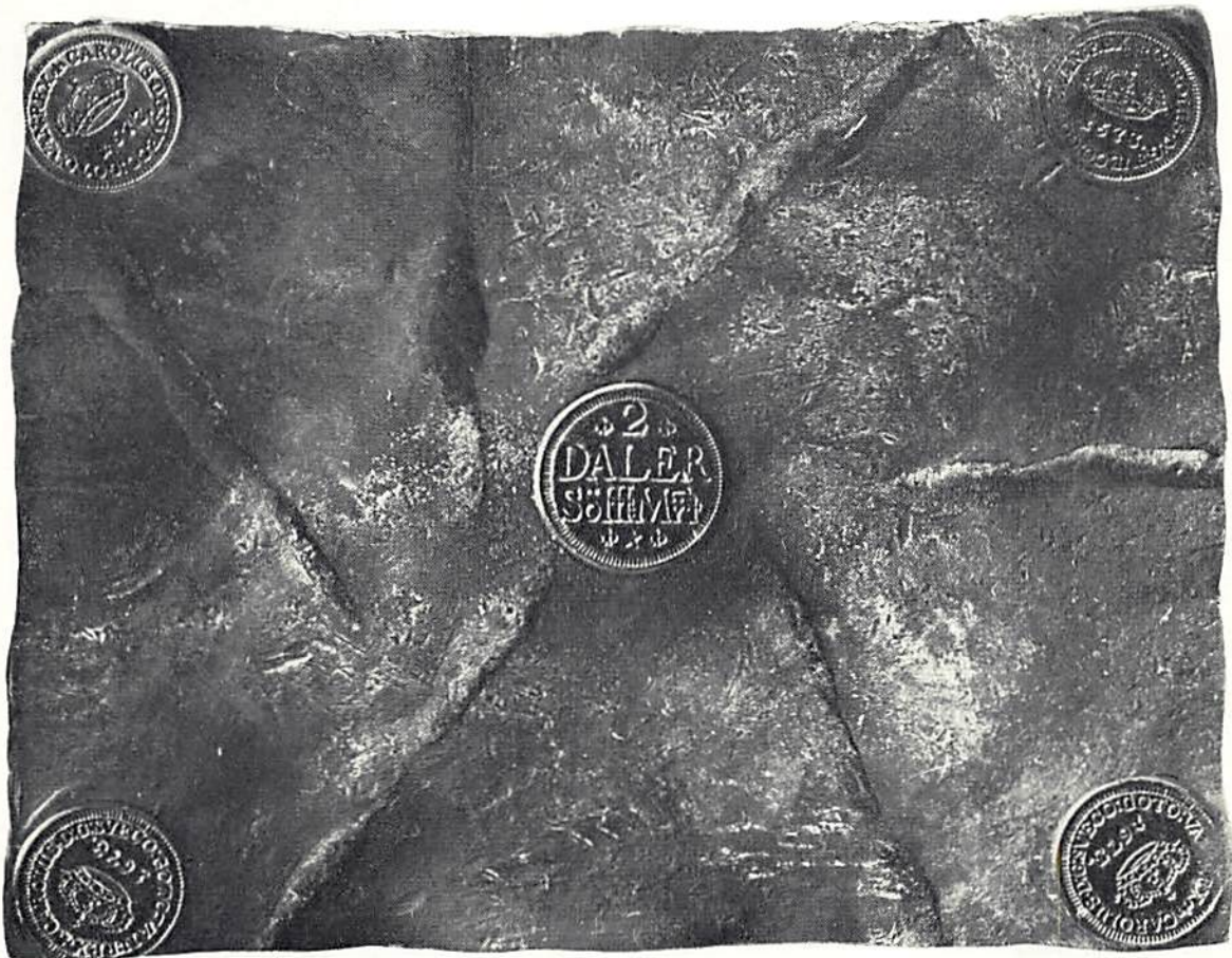
2 daler 1673

Exempel på ett skickligt förfalskat plåtmynt