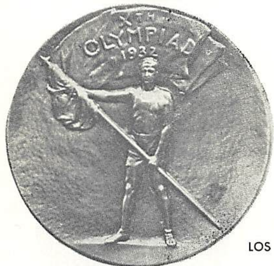
LOS ANGELES 1932