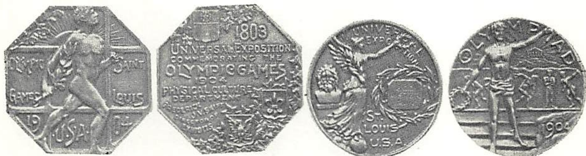
ST LOUIS 1904