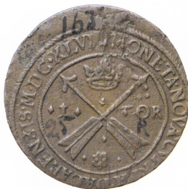
14. AVESTA. Öre 1646. SM 111. 46,72 g. SS 2550. Korroderad, snedcentrerad, bläckskrift.