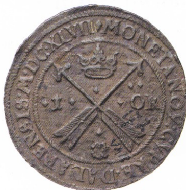
15. AVESTA. Öre 1647. SM 112. 50,53 g. SS 2562. Korroderad, bläckskrift.