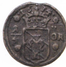
16. NYKÖPING. ¼ öre 1634. SM 122. 10,27 g. SS 2601. Korroderad, snedcentrerad.