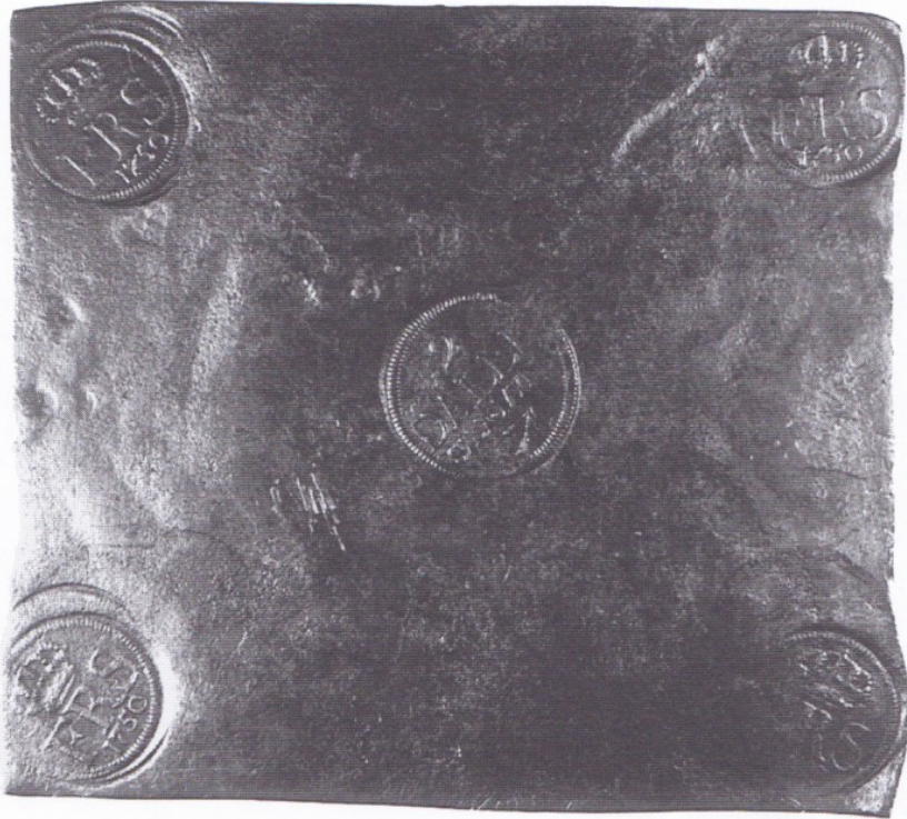
37 195 x 175 mm.