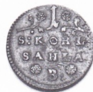
Bild 2:1-11. Ett urval av brukspolletterna vid LUHM. Notera den genomgående höga konserveringsgraden. Siffrorna hänvisar till förteckningen på föregående sida. (skala 1:1).